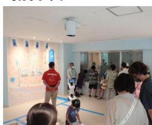
※地域交流会の風景※