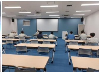
※安全衛生会議の様子※